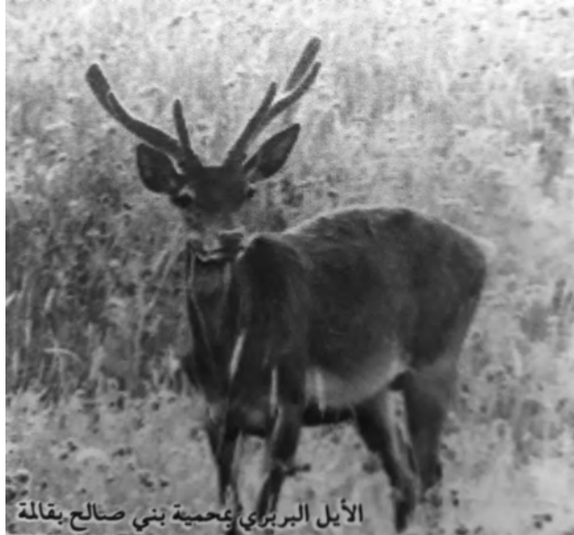
الأيل البريري بمحمية بني صالح بقالة