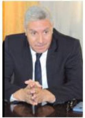
أجرت الحوار: حبيبة غريب

■ ملتقى دولي في الذكرى الثلاثين لتأسيس مركز البحث .. ■ مجلة "النسائيات" .. مرتبة أولى على موقع "النشر المفتوح" ..