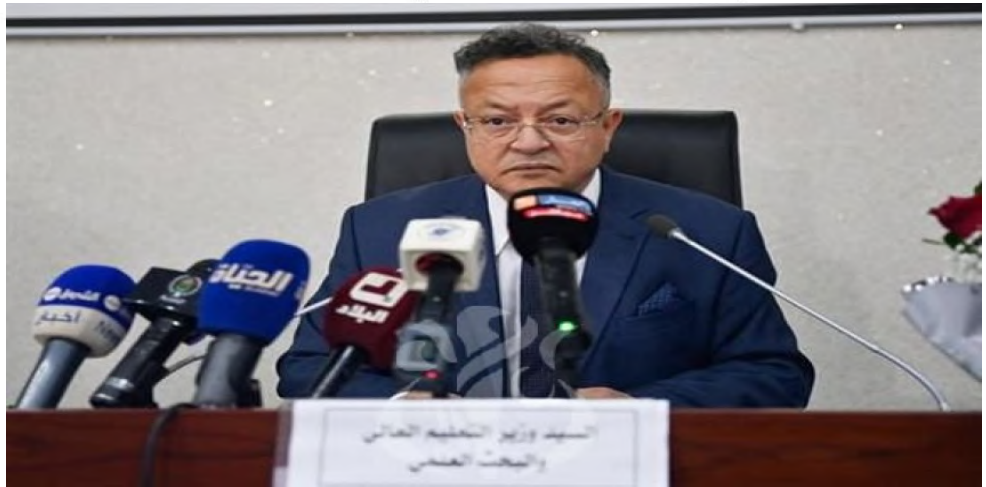
Le ministre de l'Enseignement supérieur et de la Recherche scientifique, Kamel Baddari

Les ateliers inhérents à la modernisation de l'université se tiennent au niveau de tous les campus depuis le mois d'avril, et ce, jusqu'à la mi-juin, date de clôture de ces concertations avec la communauté universitaire, avant l'organisation des assises nationales sur la réforme et la modernisation de l'enseignement supérieur. L'instauration du système LMD comme mode d'enseignement, il y a presque deux décennies, n'a pas réussi à transformer l'université algérienne en une université performante. Sa réforme est aujourd'hui on ne peut plus nécessaire, de l'avis même des pouvoirs publics. Désormais, le secteur de l'enseignement supérieur doit être un creuset de la start-up et des entreprises d'innovation, et non une «école-diplôme». Les assises en question sont prévues cette année, probablement à la rentrée prochaine, selon certaines sources. Les propositions qui en découleront, en référence aux déclarations du ministre Kamel Baddari, seront soumises au gouvernement pour enrichissement à l'effet de prendre la décision qui sied à la nouvelle vision. Mais au préalable, des chantiers pour en débattre sous forme de «Brainstorming» ont été lancés depuis plusieurs semaines dans toutes les universités nationales. Le projet, selon des membres de la communauté universitaire, est un prélude à une ouverture efficace de l'université sur l'environnement socioéconomique, contribuant à la création d'emploi et de richesse. Dans ce sillage, une commission de modernisation de