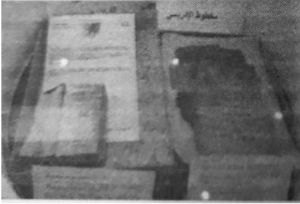
تنظيم معرض لوثائق وكتب وتجهيزات لتصوير وترميم الكتب.

الشعب، وتوقف عبيدي في كلمته عند الجهود التي بذلت في سبيل إعادة ترميم وإثراء مخزون المكتبة والذي بدأ منذ اليوم الثاني للجريمة، حيث كان الحريق يستهدف عرقلة أول دخول جامعي للجزائر المستقلة، وقد تم رفع التحدي ونجحت الجزائر الفتية في كسب الرهان.