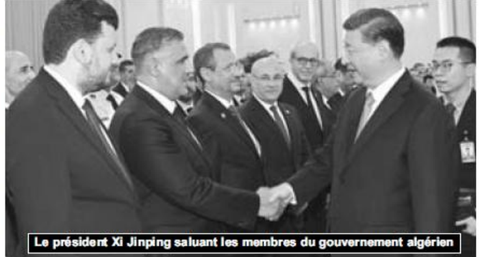
Le président Xi Jinping saluant les membres du gouvernement algérien

une vitesse supérieure afin de rattraper le temps perdu et les opportunités d'investissement avec nos amis, avec l'Afrique et la région de la Méditerranée», soulignant l'existence de «1450 projets industriels en cours de réalisation». Une opportunité pour la Chine partenaire commercial important de l'Algérie, qui occupe la 1ère place en termes d'approvisionnement du marché algérien, avec une valeur de plus de 9 milliards de dollars, soit un taux de plus de 16,5%, selon les statistiques des douanes algériennes. Elle constitue par ailleurs un partenaire de choix pour l'Algérie qui ambitionne d'atteindre les 13 milliards d'exportations hors hydrocarbures. Les deux parties ont convenu de «consolider le travail en vue de bénéficier des opportunités commerciales et d'investissement offertes, d'intensifier le contact et les visites entre les secteurs publics et privés des deux pays, de conjuguer les efforts en vue de créer un environnement d'investissement favorable, incitatif, idoine et encourageant, de consolider l'économie, le commerce et l'investissement, de raffermir les partenariats et d'ouvrir des horizons plus larges de coopération économique entre les deux pays dans différents domaines », poursuit le document et ce dans le cadre de l'Algérie nouvelle et l'initiative de la «Ceinture et la Route». Il faut rappeler qu'un accord de partenariat stratégique global a été signé, à ce titre, entre les