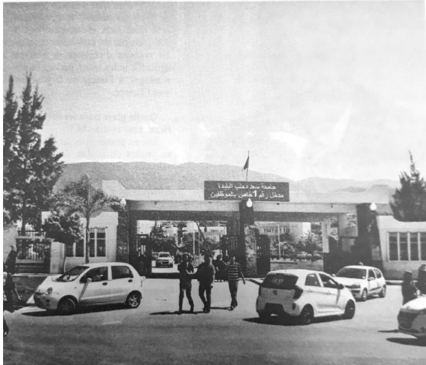
Université Saad Dahleb, Blida

son 2024/2025, où l'université aura régulièrement son espace à travers une émission hebdomadaire en direct du campus ainsi que des couvertures relatives aux activités officielles, pédagogiques et scientifiques». La même directrice a ajouté lors d'un point de presse organisé en marge de la signature de la convention que cette dernière «permettra surtout aux chercheurs de faire ressortir leurs thèses des tiroirs, tout en leur assurant, à travers des émissions et couvertures, un travail de promotion qui serait bénéfique et pour l'économie nationale et pour la société d'une manière générale».