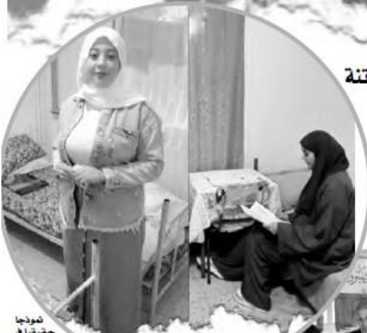
نموذجا حقيقيا في استقبال