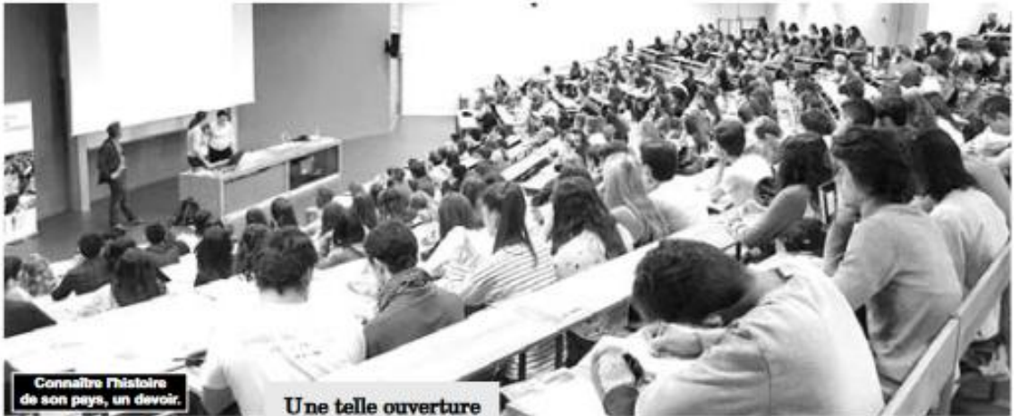
Connaître l'histoire de son pays, un devoir.

Avant d'être des écoliers, des lycéens ou des étudiants, ce sont d'abord des Algériens qui ont le devoir de connaître leur pays, sa géographie physique et humaine, son esprit et son tem-